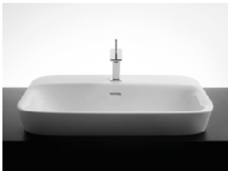
55 x 42 h10

Lavabo in ceramica da incasso con troppo pieno e quattro lati smaltati. Piletta esclusa.